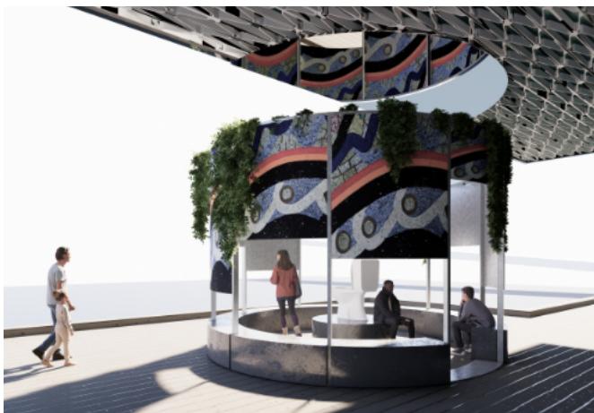
Visualisering af vores pavillon der vil blive opført foran BLOX til maj 2023.

Pavillon ved BLOX: Som led i UIA-kongressen og København som arkitekturhovedstad har Arkitektforeningen inviteret til opførelse af en række pavilloner langs havnefronten. Vi har fået en meget fin placering på trædækket foran BLOX, med udsigt over havnen, til vores pavillon, der vil blive en abstraktion over det biocenter vi opfører i Kampala. Pavillonen åbner efter planen til maj 2023 og vil blive stående til ud på sensommeren, muligvis med et efterliv hos Mellempopulært Samvirke på Nørrebro hvor vi har kontor. Mere her .