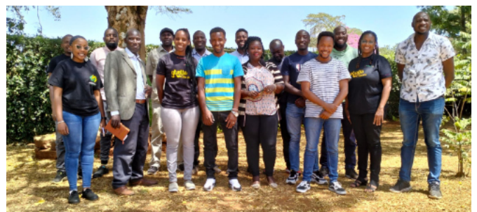
Deltagere fra partnerorganisationer i Korogocho.

Kenya: Efter flere års forberedelse lykkedes det i 2022 at få finansiering til et projekt i slumkvarteret Korogocho i Nairobi, som vil opgradere et lokalt byrum, der anvendes af en række lokale civilsamsfundsorganisationer med fokus på børn og unges trivsel, sundhed og uddannelse. Projektet involverer desuden studerende fra arkitektskolen i Nairobi i forberedelserne og har også lokale arkitekter ansat. Læs mere her .