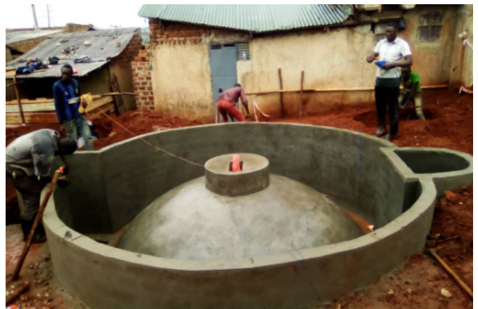
Den underjordiske, gas-producerende, del af biocenteret i Kampala stod færdig i sept. 2022.

Uganda: et jordrettighedsprojekt iværksat i 2018, er gradvist morfet over i et kooperativt sanitetsprojekt i et slumkvarter i hovedstaden Kampala. Her begyndte vi opførelsen af et såkaldt biocenter i 2022, som er en sanitetsbygning med toiletter, bade, vandsalg, boliger og en urban farming-komponent. Og så producerer bygningen biogas! I samarbejde med vores to dygtige partnerorganisationer National Slum Dwellers Federation of Uganda og ACTogether er det lykkedes at få Kampala kommune med på projektet, og det er på tale at skalere op til flere slumkvarterer fremover. Læs mere her .