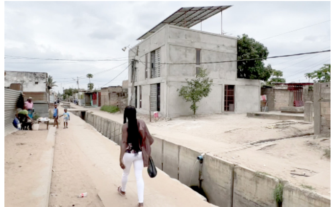
Det senest færdiggjorte hus i Casas Melhoradas-serien. Hør mere d. 16. marts kl. 19-21.