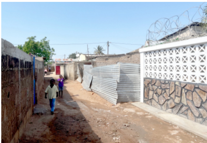
Før forestående gadeudvidelse i slumkvarteret Maxaquene i hovedstaden Maputo, Mozambique.