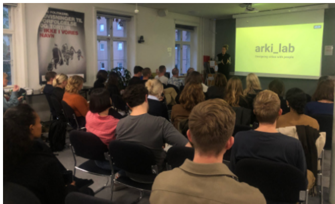
»At designe med mennesker« Aften Uden Grænser-aften i juni 2022