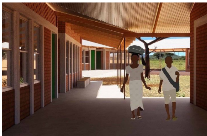
Indtryk fra kommende skole i Sarame, Tanzania