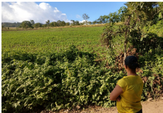
Før forestående gadeudvidelse i slumkvarteret Maxaquene i hovedstaden Maputo, Mozambique.

Nicaragua: Her har vi indgået samarbejde med den danske socialøkonomiske virksomhed Café Directo og et nicaraguansk partnerkooperativ omkring design og opførelse af en multifunktionel kaffecentral i det nicaraguanske højland. Målet er at lade lokale kooperative kaffeproducenter få større andel i værditilvæksten på deres afgrøder, og samtidigt