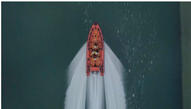
Screenshot fra filmen Coastguards, del af migrations-temaet under CAFX-festivalen.

CAFX i Kødbyen. AUG deltog i Copenhagen Architecture Festival 2022 med et oplæg til tre film om migration, på en propfuld aften hos Space10 i Kødbyen. Som bonus havde vi inviteret den anerkendte migrations-forsker Faten Kikano med via en online forbindelse. Faten gæster os igen til sommer, da hun er Canadisk bestyrelsesmedlem af Architecture Sans Frontières, og i den forbindelse afholder et UIA-sideevent om migration.