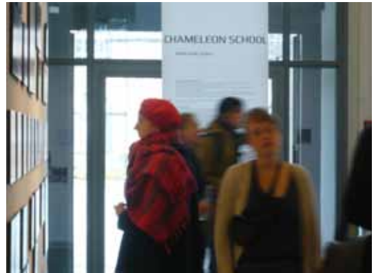
INDIEN , CHAMELEON SCHOOL